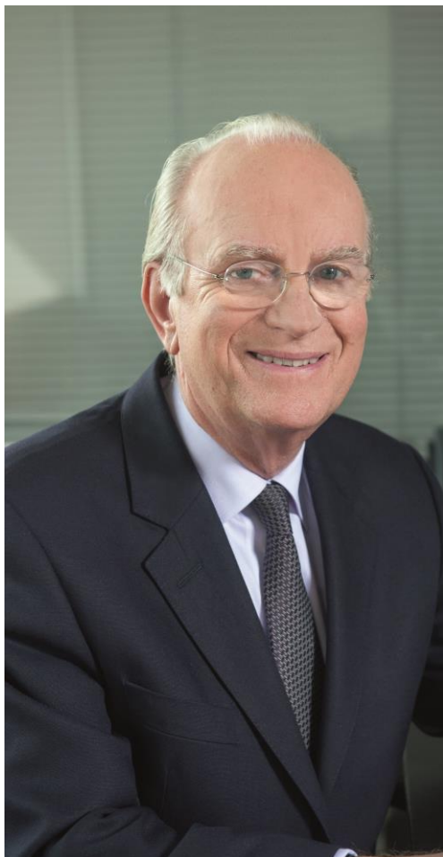
Christopher Cole Presidente di Applus+

Il nostro Codice è basato sull'integrità e la professionalità del nostro processo decisionale e stabilisce una serie di principi generali che devono indirizzare il nostro comportamento quotidiano in qualità di membri di Applus+. Il Codice definisce quindi un framework che intende andare oltre il semplice rispetto delle leggi.