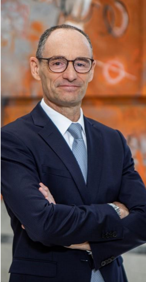
يوان أميغو Applus+ CEO

ومن ثمَّ تقع على عاتقنا جميعًا حماية سمعة المجموعة، ما يعني التصرف بمصداقية وأمانة ومعاملة أصحاب المصلحة، سواء أكانوا متعاونين داخليين أم خارجيين، وعملائنا والمساهمين والشركاء والموردين بطريقة عادلة وصادقة.