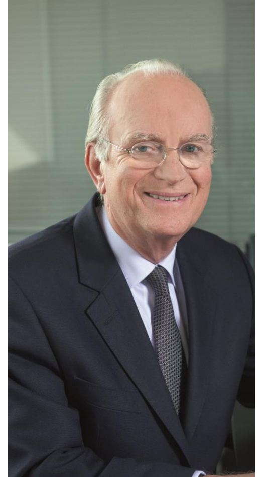
كريستوفر كول رئيس شركة Applus+

إن نمو الأعمال التجارية والحفاظ على معايير عالية من حيث الإدارة والامتثال للوائح هما عنصران يعزز كل منهما الآخر. إن بناء الثقة مع عامة الناس عملية تدريجية تتطلب جهدًا مستمرًا.